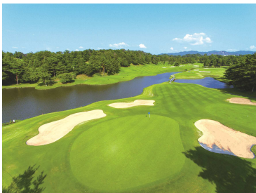
瀬田ゴルフコース 北コース

※料金には1名さまの1泊室料、夕食、朝食、北コース1Rプレーフィー(グリーンフィー、キャディーフィー、利用税)、サービス料、消費税が含まれております。※こちらのプランは2名さまより承ります。※ご予約はご宿泊の14日前まで承ります。