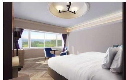
オーシャンビュースーペリアカルテット(イメージ)