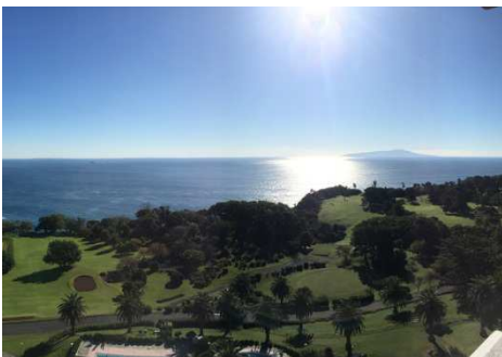
ホテルから望む相模灘

“日本の川奈ホテルから世界の川奈ホテル”を目指し、川奈ブランドの訴求を図ってまいります。