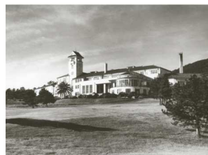
1957年以前の川奈ホテル外観