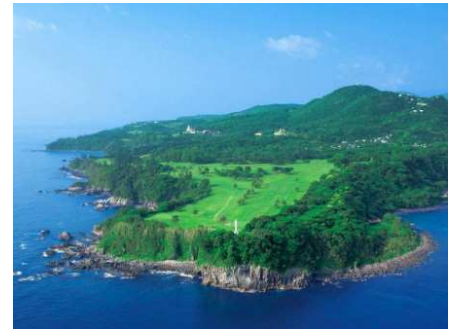
世界ゴルフ 100 選に選出された富士コース

◎本件に関する報道各位からのお問合せは 川奈ホテル セールス&プロモーション(企画広報) TEL:0557-45-1111(直通) FAX:0557-45-1114