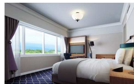
オーシャンビューキング(イメージ)