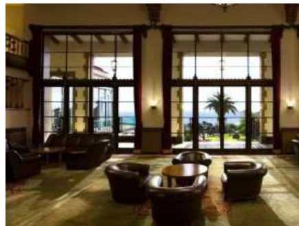
日本クラシックホテルの会に加盟する 1936 年開業の川奈ホテル