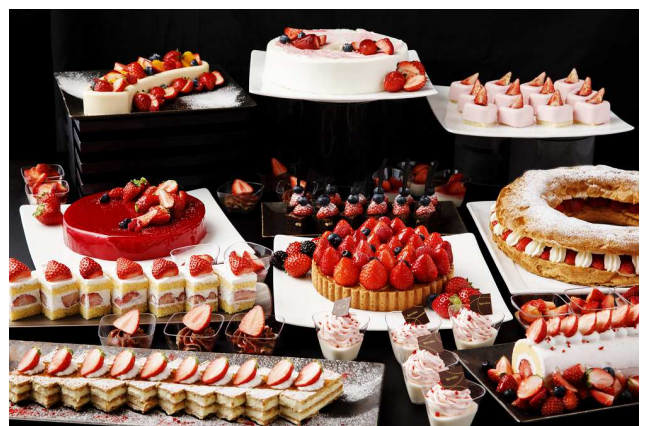
上：AWA LOUNGE 下：Strawberry Sweets Buffet イメージ

※2018年2月10日(土)～14日(水)は様々なショコラスイーツなどが並ぶ「Chocolate &amp; Strawberry Sweets Buffet」を開催いたします。