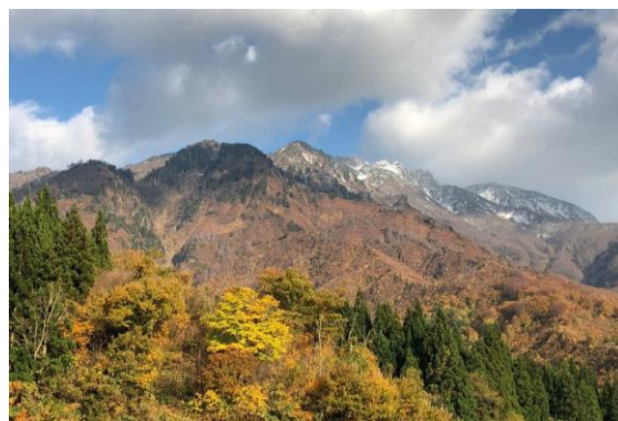
“霊峰 八海山”の初冠雪と紅葉

◎本件に関する報道各位からのお問合せは 八海山ロープウェイ(六日町八海山スキー場) 営業 TEL:025-775-3311 FAX:025-775-3173 http://www.princehotels.co.jp/amuse/hakkaisan