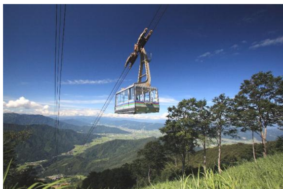
夏の八海山ロープウェイと魚沼平野

展望台からは、周囲 360 度の大パノラマが広がり、越後平野や魚沼盆地・上信越国境の山々、そして快晴時には日本海や佐渡島も一望できる、全国でも屈指の好展望地です。