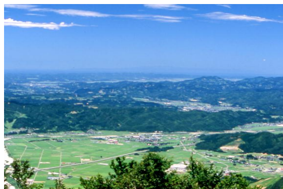
展望台からの眺望(佐渡島方面)