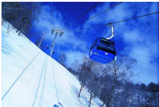
苗場-田代ゴンドラ