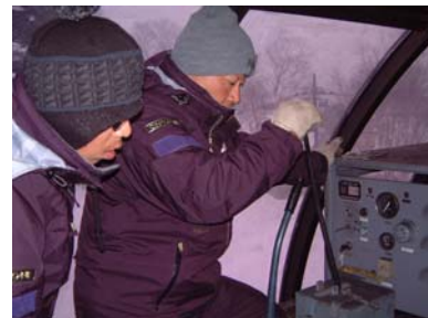
予備原動装置操作訓練