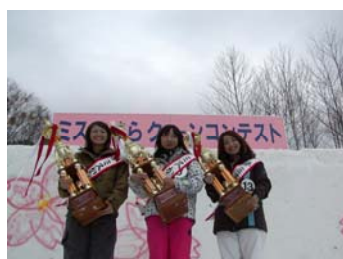
ミス・かぐら クイーンコンテスト