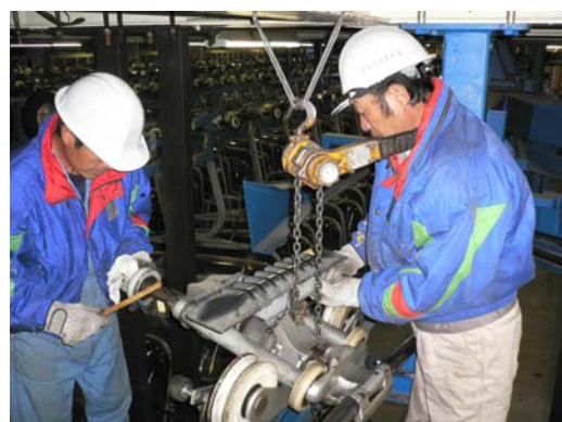
搬器握索装置解体整備