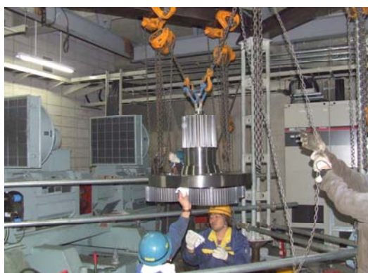
ゴンドラ減速機解体整備