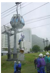
ゴンドラ救助訓練