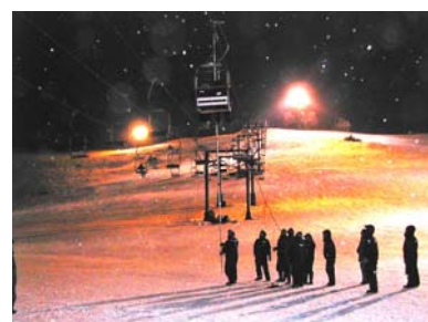
ロマンスリフト救助訓練