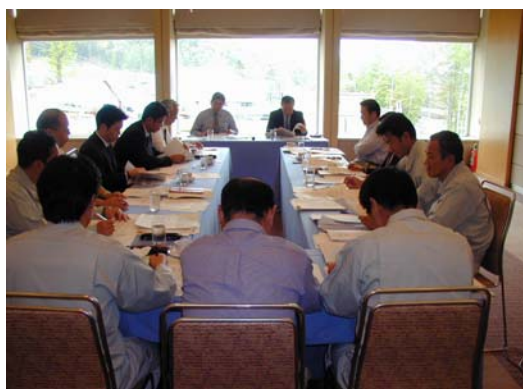
地区役員、総・支配人、索道安全統括管理者等が出席する地区安全会議（北海道地区）

全国9箇所のスキー場および索道管理部に対して、監査部による内部監査が実施されました。安全管理規程の遵守状況、労務管理等について確認が行われました。