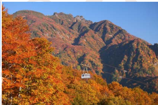
八海山ロープウェイ