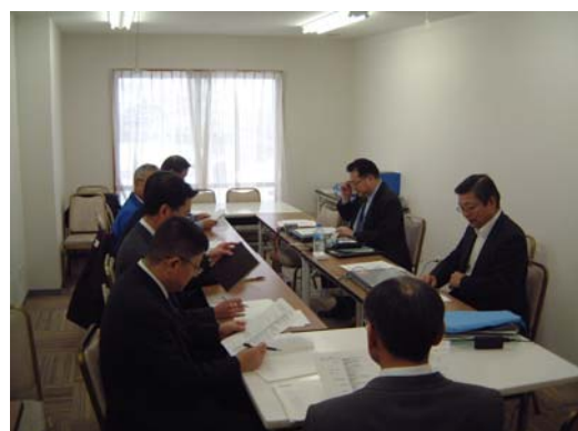
監査部による内部監査（万座温泉スキー場）