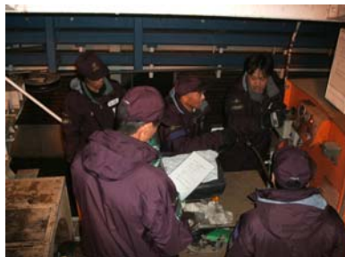
予備原動装置操作訓練