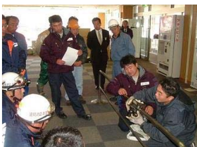
消防署との合同訓練