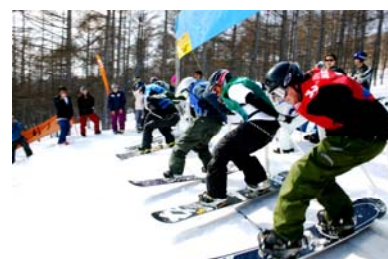
新潟ときめき国体 スノーボードクロス大会