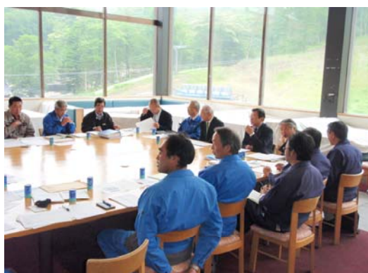
地区役員、総・支配人、索道安全統括管理者等が出席する地区安全会議（長野群馬地区）