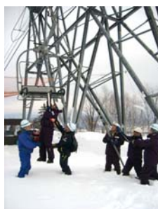
ロマンスリフト救助訓練