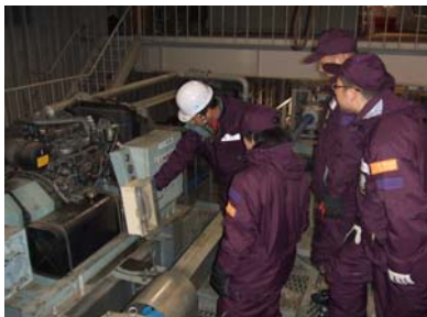
予備原動装置操作訓練

索道が不時停止した場合、予備原動装置に切り替えて運転する方法と、救助装置によりお客さまを救助する方法があります。 緊急時にも冷静な判断と的確な操作が行えるよう、日頃から訓練しています。