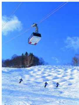
富良野ロープウェイ