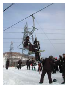
ロマンスリフト救助訓練