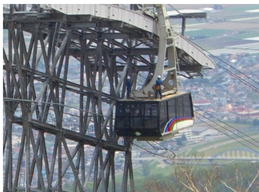
ロープウェー支柱点検