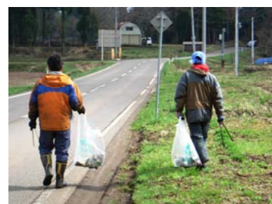
スキー場沿線道路清掃