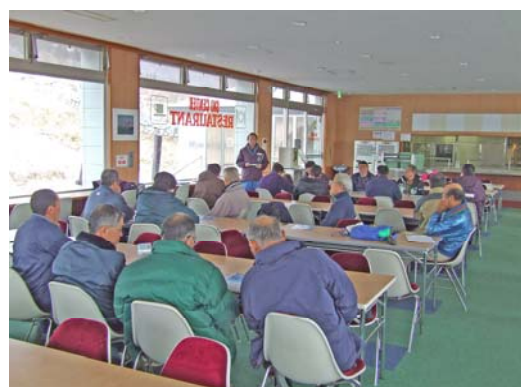
索道技術管理者による冬期臨時社員業務説明会