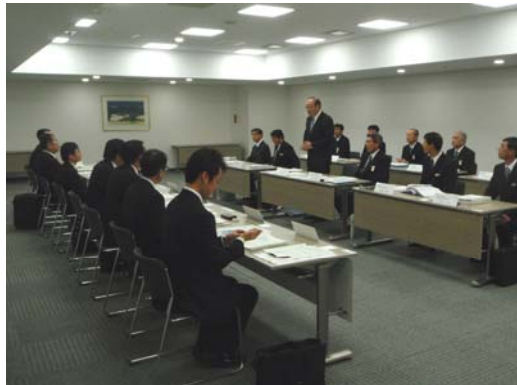
オープニングミーティング