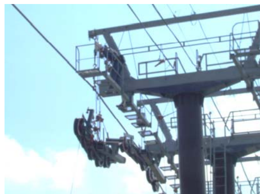
ゴンドラ索受整備