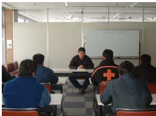
スキー場支配人による「従業員安全教育」