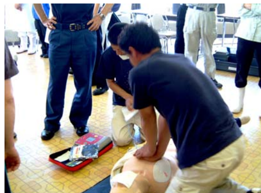
お客さまの緊急事態に備えて広域消防署主催の救急法講習会に参加、AED取扱い訓練