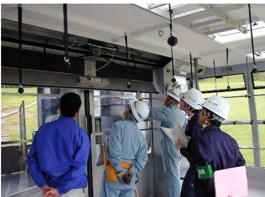
富良野ロープウェー搬器内、保安装置の説明