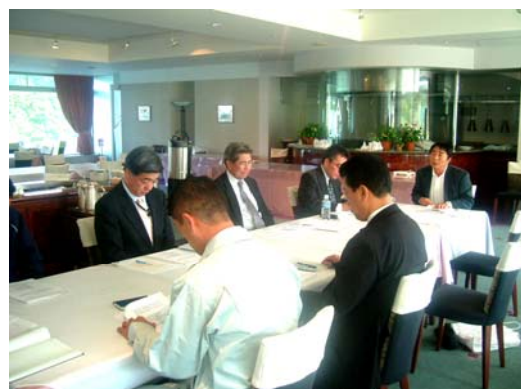
地区総支配人・索道安全統括管理者等が出席する地区安全会議（東北地区）