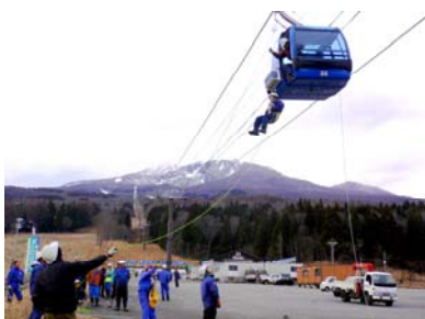
ゴンドラ救助訓練