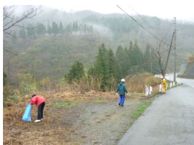
スキー場付近の県道清掃

各地のスキー場では、お客さまに良好な自然環境でのスキースポーツを満喫していただくために、環境保全に力を注いでいます。シーズン中、シーズン後に各索道線下・駐車場・林間コース・ゲレンデ等の清掃・整備を行っています。