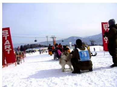
スノードッグフェスティバル