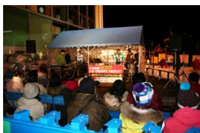
地元放送局35周年記念イベント