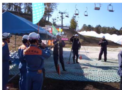
消防署との合同訓練