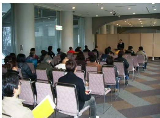
冬期臨時社員安全教育・労務管理説明会

各事業所の索道技術管理者が、それぞれの要員について技能や経験を基に力量を判断し、必要な教育を決定して年間の教育訓練計画を策定しています。計画されたもののほか、計画外の教育についても必要に応じて実施しました。