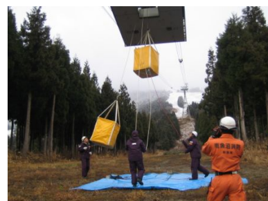
消防署との合同訓練