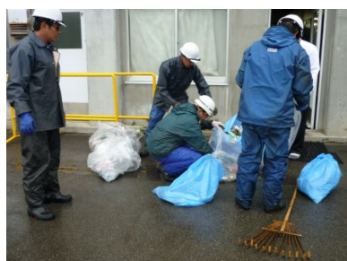
清掃後のゴミの分別処理