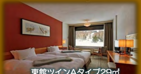
東館ツインAタイプ29㎡