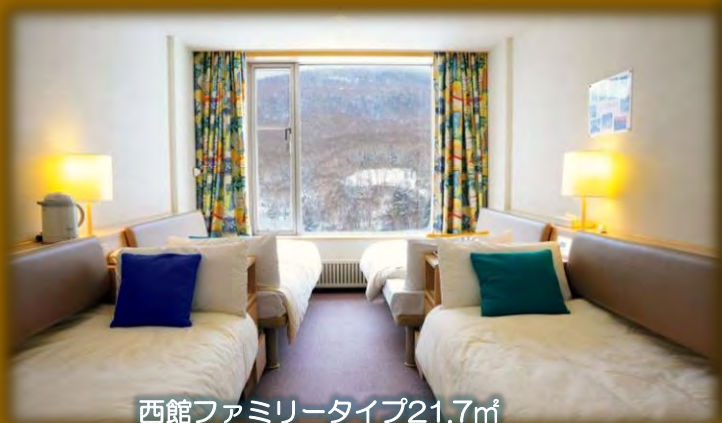
西館ファミリータイプ21.7㎡