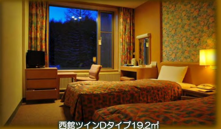
西館ツインDタイプ19.2㎡