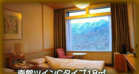
南館ツインCタイプ18㎡

※土、休前日をご利用の場合は1日1室¥3,000の追加料金となります。(3/20は平日扱い)