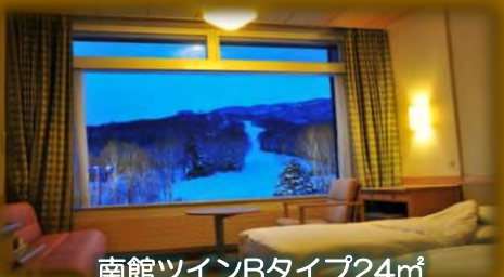
南館ツインBタイプ24㎡