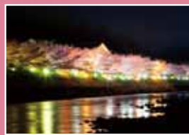
夜桜ライトアップ《期間中毎日18時～21時》