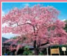
飯田家の河津桜原木