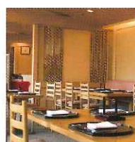
軽井沢プリンスホテル ウエスト

雄大な浅間山を望むレンガ造りのゆったりとした空間。豊富なヴィンテージワインとともに、食材にこだわったフレンチをお楽しみください。