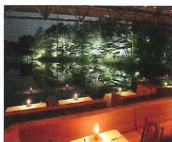
ザ・プリンス 軽井沢