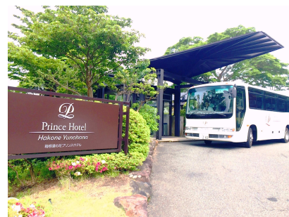
送迎バス (イメージ)

前日までにご予約いただければ小田原駅とホテル・ゴルフ場間の往復直通便のほか、ザ・プリンス箱根芦ノ湖とを往復する直通便もご利用いただけます。宿泊後のプレーはもちろん、プレー後の宿泊と翌日に箱根園(芦ノ湖)周辺の水族館や遊覧船・ロープウェイなど思い思いの箱根の観光が、より便利により快適にお楽しみいただけます。