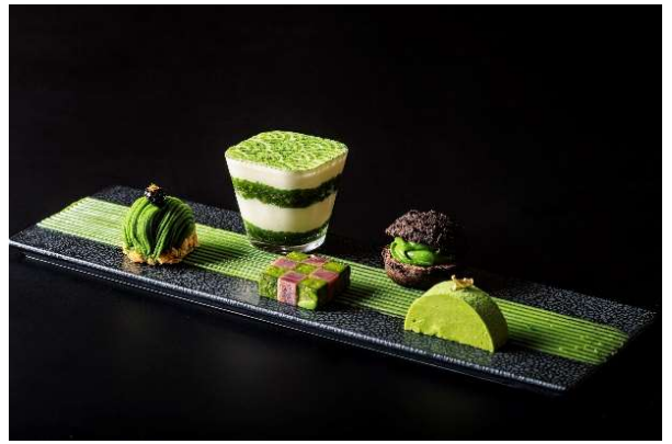
武家の古都プレート(イメージ)