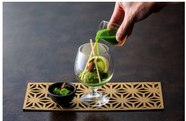
京都福寿園 抹茶のアフォガード(イメージ)