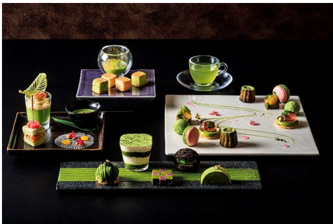
京都福寿園×鎌倉アフタヌーンティー～武家の古都と雅の古都～(イメージ)