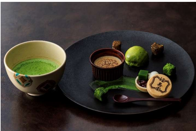
抹茶スイーツの盛り合せ おうすとともに(イメージ)