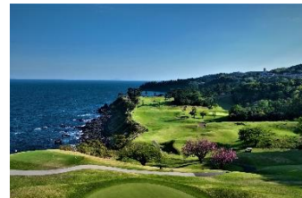
断崖絶壁の上から望むNo.15