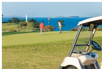
絶景コースを二人占め