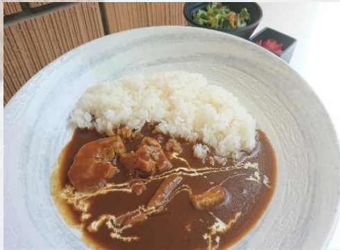
じっくり煮込んだ ポークカレー