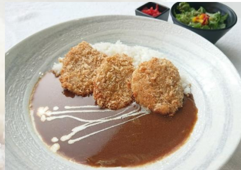
豚のひれかつカレー