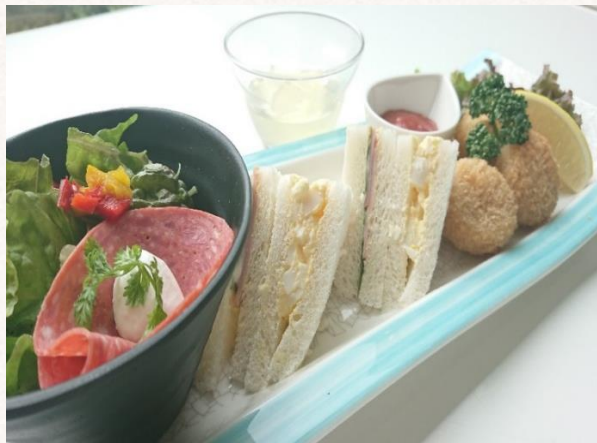
ランチタイム サンドプレート