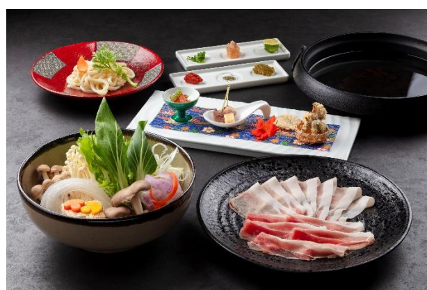
信州米豚しゃぶしゃぶ