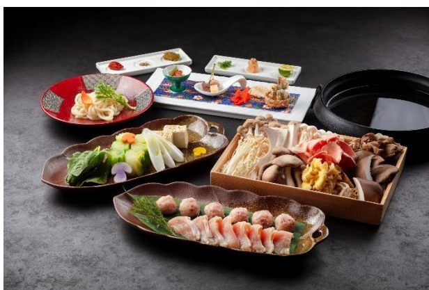
信州産茸鍋 信州味噌と酒粕仕立て

* 定休日：2025.1/6～1/31 期間中の月曜日 * 年末年始期間：2024年12月28日（土）～2025年1月5日（日）