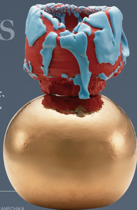
〈桑田卓郎〉 茶碗 Tea bowl