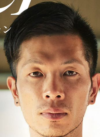
Takuro Kuwaza 桑田卓郎

日本の伝統文化や美意識を現代の文脈で捉え直し、工芸的な手法で精緻につくり上げた作品を通じて、新たな視点を提示するアーティスト。東京を拠点に、国内外で幅広い活動を展開。代表作「ヒールレスシューズ」は江戸時代の高下駄から着想を得た作品で、ニューヨークのメトロポリタン美術館やロンドンのヴィクトリア&アルバート博物館に収蔵されている。