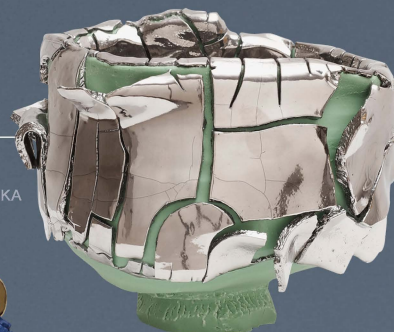
Photo by Yasushi Ichikawa ©Takuro Kuwata, Courtesy of KOSAKU KANECHIKA