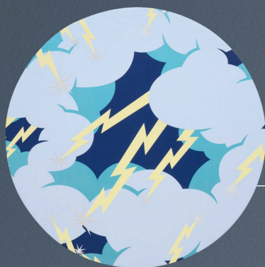
〈館鼻則孝〉 Descending Painting