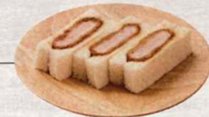
ハニーマスタードヒレかつサンド